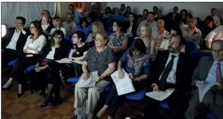
Imagen del Pre-Congreso que se desarrolló en la sede de AABYMN

que conoceremos con más detalles lo que nos ofertan los Laboratorios de la Especialidad y el mundo de los radiopéptidos. Tórax y mediastino serán presentados por profesionales de excelencia. Nefrourología, tema vigente, también será discutido. La cultura de la Radioprotección que es parte de nuestro trabajo diario y que nos inculca la Autoridad Regulatoria Nuclear, será expuesto por seleccionados profesionales tanto en su calidad científica como didáctica. La instrumentación